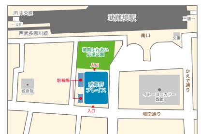
武蔵野駅南口 徒歩1分

休館日 水曜日（祝日と重なる場合は開館し、翌日休館）、毎月第3金曜日（その週の水曜日は開館）、年末年始、図書特別整理日